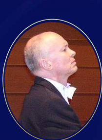
ローナン・マギル / ピアノ Ronan Magill / Piano