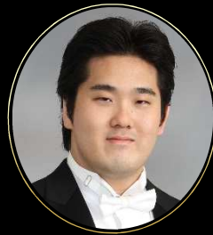
新海 康仁 / テノール Yasuhito Shinkai / Tenor