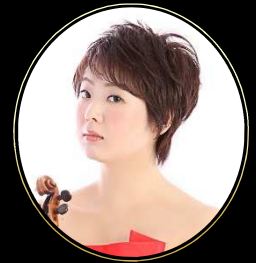
泉 里沙 / ヴァイオリン Risa Izumi / Violin