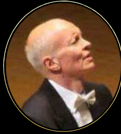
ローナン・マギル / ピアノ Ronan Magill / Piano