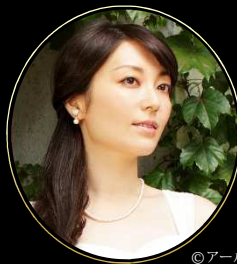
新居 由佳梨 / ピアノ Yukari Arai / Piano